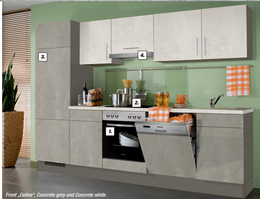
Front „Celine“, Concrete grey und Concrete white