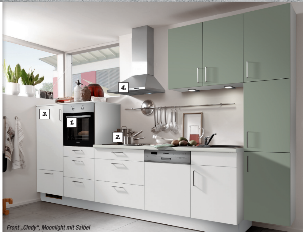
Front „Cindy“, Moonlight mit Salbei