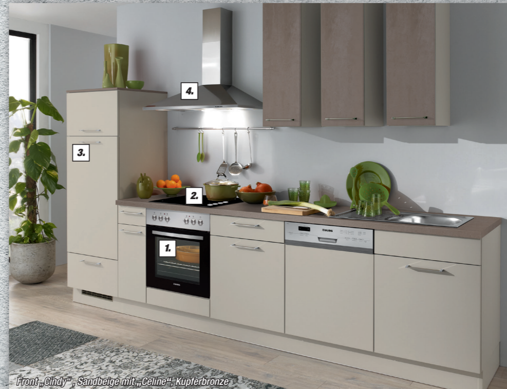
Front „Cindy“, Sandbeige mit „Celine“, Kupferbronze