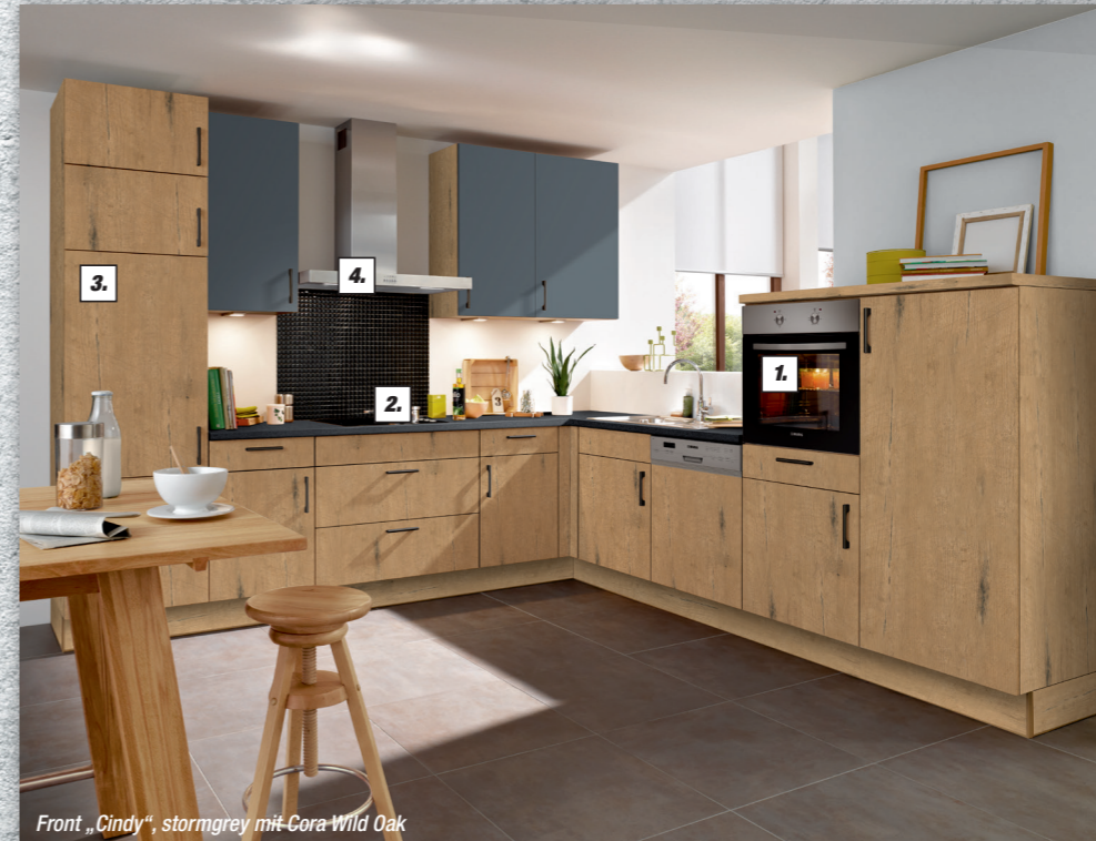
Front „Cindy“, stormgrey mit Cora Wild Oak